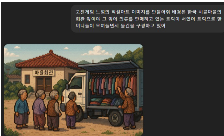
AI를 활용한 아름다운재단 캠페인 페이지 제작 과정

경북 산불 재해 지원을 주제로 한 첫 번째 페이지에서는 고전 도트 게임 스타일의 이미지를 생성하여 재해 현장의 분위기를 구현하였으며, 무장에 놀이터를 주제로 한 페이지에서는 낮과 밤 두 버전의 이미지를 생성하여 스크롤 흐름에 맞게 배치하였다. AI 이미지 생성 외에도 아이디어 발상, 개념 설명, 경향성 파악, 간단한 코드 생성 등 다양한 업무에 AI를 활용하였다.