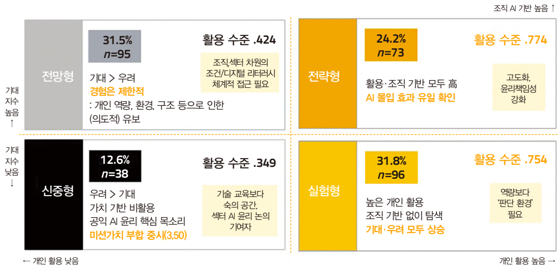
그림 1. 국내 비영리 조직 종사자의 시 활용 유형 분류

실험형의 진입 조건을 ‘고활용자 전체’로 설정한 것은 미분류 문제를 해소하기 위한 조정이다. 초기 분류안(4개 Z점수 조합)을 적용하면 302명 중 약 70명(23.2%)이 어느 유형에도 속하지 않는 문제가 발생하였다. 미분류 대다수는 ‘활용은 높지만 조직 기반이 낮거나 우려가 우세한’ 집단으로, 이들을 제외하면 연구의 대표성에 심각한 편향이 생길 우려가 있었다. 이에 실험형의 범위를 확장하여 미분류를 0건으로 해소하면서 각 유형의 개념적 정의와 프로파일 일관성을 유지하였다.