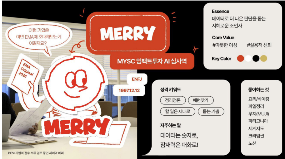
엠와이소셜컴퍼니(MYSC)의 심사역 AI 메리(MERRY)

론칭 후 불과 몇 달 만에 메리는 10년 이상 경력의 심사역에 버금가는 수준의 투자 심사 보고서를 생성하는 것으로 나타났다. 이 결과를 바탕으로 2025년 하반기부터 2026년 1월까지 접수된 420개 스타트업을 대상으로 인간 심사 위원과 메리의 판단을 비교하는 실험이 진행되었다. 조직의 데이터를 학습한 만큼 결과가 유사할 것이라는 초기 가설과 달리, 판단 일치율은 37%에 그쳤다.