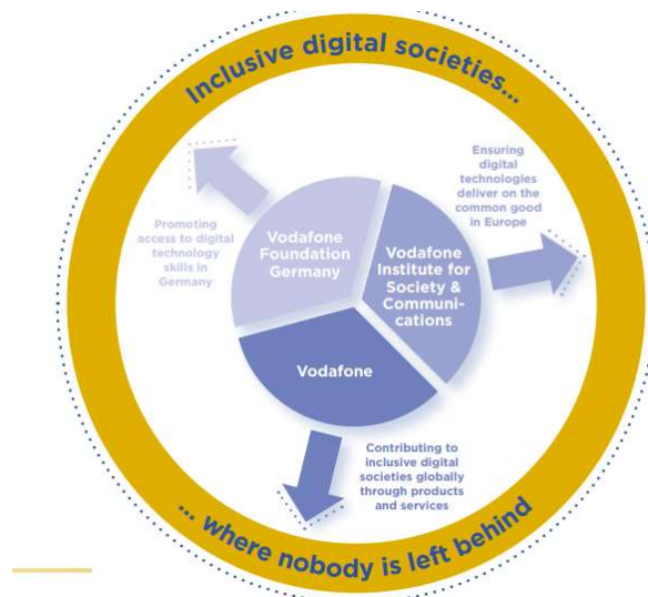
그림 2. 보다폰, 보다폰 독일 재단, 보다폰 사회통신 연구소의 각 역할 수행 및 공통 목표

출처: EVPA. (2020). Collective Corporate Impact Strategies.